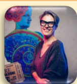
Dr.ssa Vera Gheno

Laureata in Sociologia, ha svolto esperienze di volontariato in Italia in diverse strutture sociali e socio-sanitarie, presso associazioni che si occupano di sport e disabilità, nei servizi di urgenza ed emergenza, e in Africa in centri per bambini. Ha lavorato per molti anni nel campo dell'assistenza, della cura, dell'educazione e dell'accoglienza di persone adulte con disabilità intellettiva. Ha diretto una Comunità Alloggio a Como, è stata assessore alle Politiche Sociali e Vicesindaco, parlamentare e assessore alle Politiche sociali e della Famiglia di Regione Lombardia. Dal 22 ottobre 2022 è Ministro per le Disabilità nel governo Meloni.